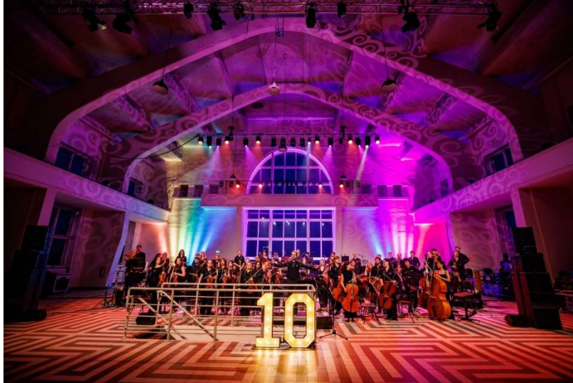
Zomertournee Jong Metropole 2025 in Radio Kootwijk met viering van het 10-jarig jubileum van dit orkest

In het kader van het internationale uitwisselingsprogramma MusXchange van de European Federation of National Youth Orchestras speelden vier musici uit verschillende nationale jeugdorkesten uit andere EU-landen mee.