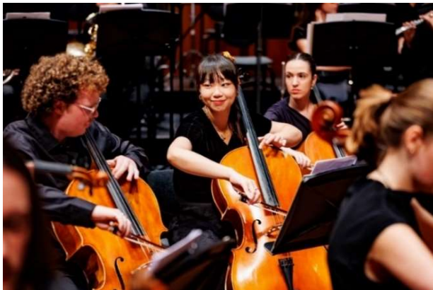
Nationaal Jeugdorkest Zomertournee 2025

NJON ondersteunt de beste, jonge, muzikale talenten vanaf 14 jaar, alsook conservatoriumstudenten in hun ontwikkeling en bij het eventueel opbouwen van een professionele carrière als musicus. Geselecteerde toptalenten krijgen de kans om ervaring op te doen in orkest- en ensemblespel en coaching en training te volgen. Ze maken eigen producties en doen podiumervaring op onder leiding van de beste coaches, docenten en dirigenten.