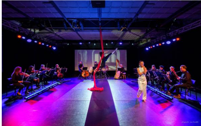
“Blauwbaard”, NJO Muziekzomer 2019

Elk jaar heeft een young artist in residence een prominente plek binnen het festival: een uitzonderlijk getalenteerde, jonge, Nederlandse musicus met een brede interesse in en ideeën over (interdisciplinaire) vormen van podiumkunst. Deze wordt ondersteund bij het ontwikkelen en uitvoeren van bijzondere programma's.