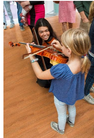
Eerste kennismaking jongste generatie

De NJON zijn ook al jaren een leerinstituut en carrièreontwikkelingsplek voor personeel: vele talentvolle professionals op het gebied van cultuurmanagement, programmering, productie en marketing ontwikkelen zich in dienst van de NJON en vinden hun weg naar zeer uiteenlopende functies in het culturele veld.